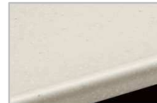
ソリッドベージュ

最高級クラスの人造大理石ならではの落ち着いた雰囲気と滑らかな質感。上質なキッチン空間を演出します。