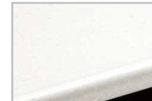
ソリッドホワイト