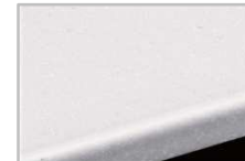
ソリッドライトグレー